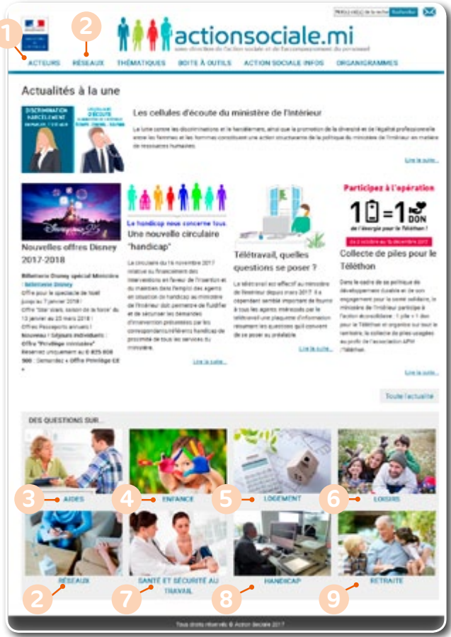
Des sous-rubriques sont proposées pour chaque thématique afin de vous guider.

>>> En savoir plus >>> Nouvel Intranet de l'action sociale : > http://actionsociale.mi ou > http://actionsociale.interieur.ader.gouv.fr